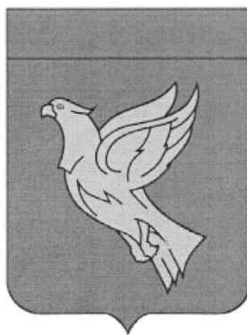
СХЕМА ТЕПЛОСНАБЖЕНИЯ города Мензелинск и Мензелинского муниципального района Республики Татарстан до 2035 года